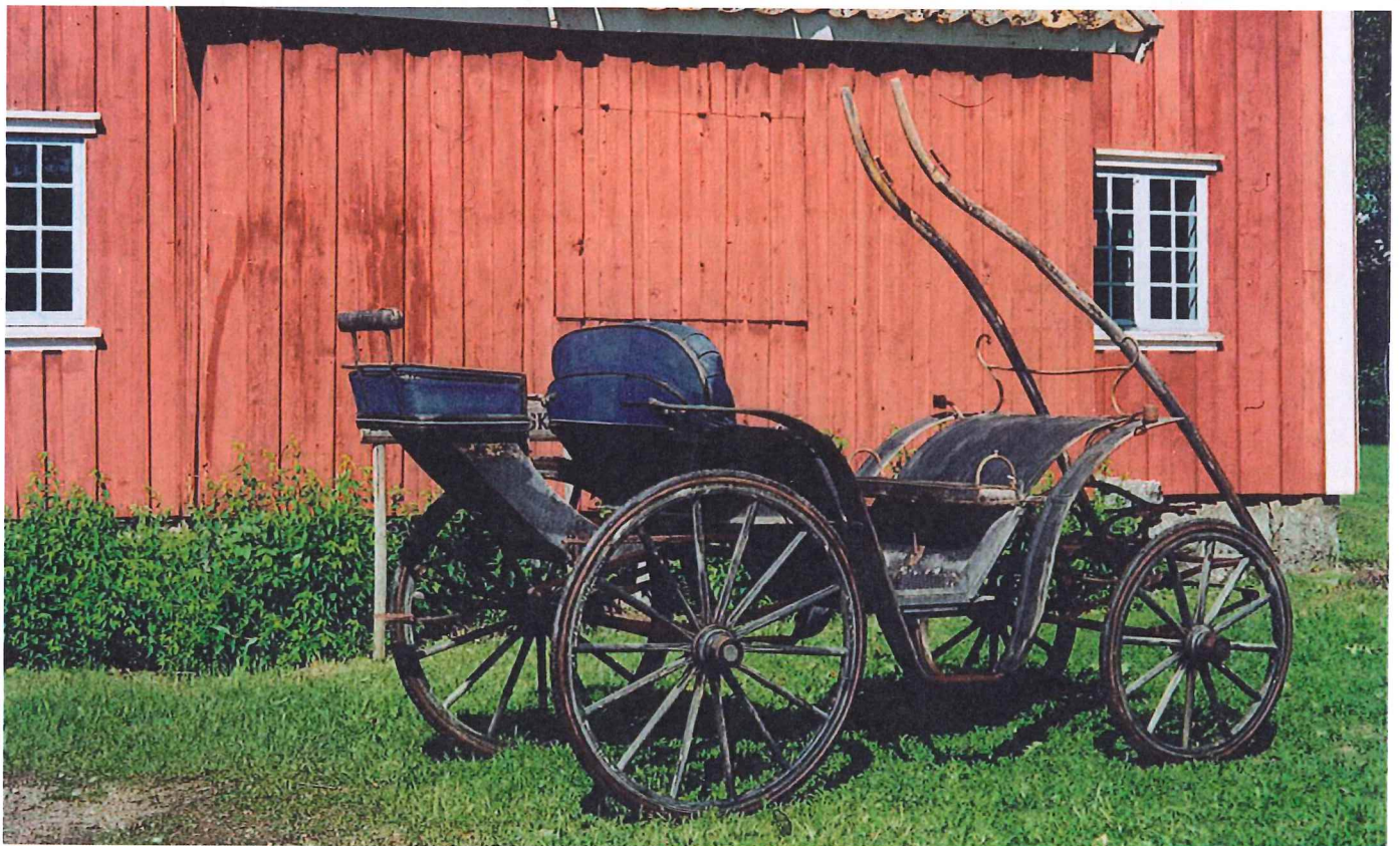
Trille/Ponnivogn fra Rakkestad